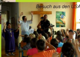
Besuch aus den USA

Unsere Schule steht allen Kindern offen, unabhängig von ihrer Konfession und Weltanschauung. Die gegenseitige Toleranz und die Akzeptanz ist Grundlage unserer Konzeption.