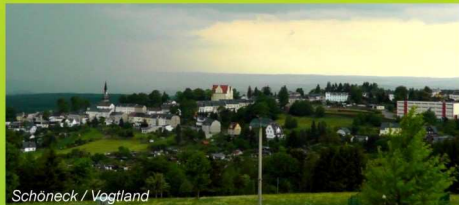
Schöneck / Vogtland

Unsere Schule befindet sich in dem schönen Städtchen Schöneck, welches bereits seit über einhundert Jahren als Paradies für Wanderer und Wintersportler gilt. Das angrenzende IFA Ferienhotel bietet zudem Bademöglichkeiten im Hallenbad, Kletterpark, Ski- und Rodellift und weitere Freizeitaktivitäten. Als Schule lassen wir uns diese natürlich nicht entgehen.