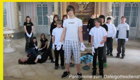
Pantomime zum Ostergottesdienst

Unser Anliegen ist es, Werte und Normen auf der Grundlage des christlichen Menschenbildes und deren Glaubensinhalte und Traditionen zu vermitteln bzw. erfahrbar zu machen. Dies soll sich nicht nur innerhalb sondern auch außerhalb des Pflichtfaches Religion widerspiegeln, indem der Schullalltag auf die verschiedenen Höhepunkte des Kirchenjahres ausgerichtet ist. Christliche Feste werden gemeinsam vorbereitet und gefeiert, wobei stets eine enge Zusammenarbeit mit der Gemeinde, den Kirchen und den Pfarrern vor Ort besteht.