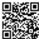
Evangelische Grundschule Oelsnitz